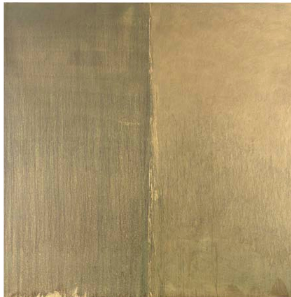
Two Golds , 2009-2010 Huile sur toile - 213,4 x 213,4 cm