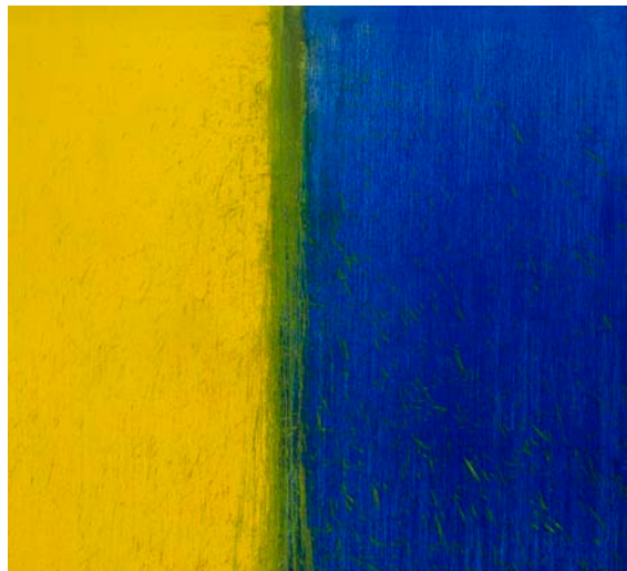
Yellow and Blue , 2009 Huile sur toile 213,4 x 213,4 cm

Le travail de l'artiste a fait l'objet de très nombreuses expositions comme récemment au Contemporary Arts Center, Cincinnati, (architecte : Zaha Hadid, 2010), au ZKM de Karlsruhe en Allemagne (2006), au Whitney Museum, New York (2004) ou au Des Moines Art Center, Iowa (2003), et figure dans de nombreuses collections publiques renommées telles le Metropolitan Museum of Art, le MoMA, le Musée Solomon R. Guggenheim de New York mais aussi la National Gallery of Art de Washington ou encore la Tate Gallery de Londres.