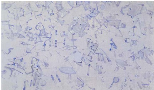
Rive gauche , 1955 - Tempera sur papier - 61 x 91 cm

Toutes les images figurant dans ce dossier sont à créditer, sauf indication contraire : Courtesy Galerie Jeanne Bucher - Jaeger Bucher, Paris