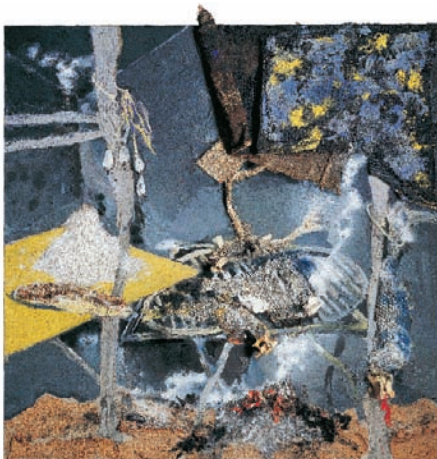
L'étang à l'automne , 2001 Huile et technique mixte sur toile - 114 x 146 cm