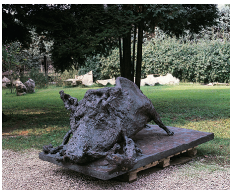
Sanglier , 2001 Bronze - 115 x 190 cm - 500 kg