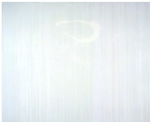
Sun moon , 2005 Huile sur toile- 278,1 x 347,9 cm