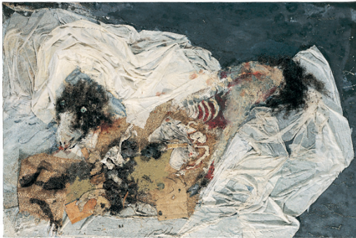
Mouton noir dépecé , 1994 Technique mixte sur toile - 130 x 195 cm

Toutes les images figurant dans ce dossier sont à créditer, sauf indication contraire : Courtesy Galerie Jeanne Bucher, Paris