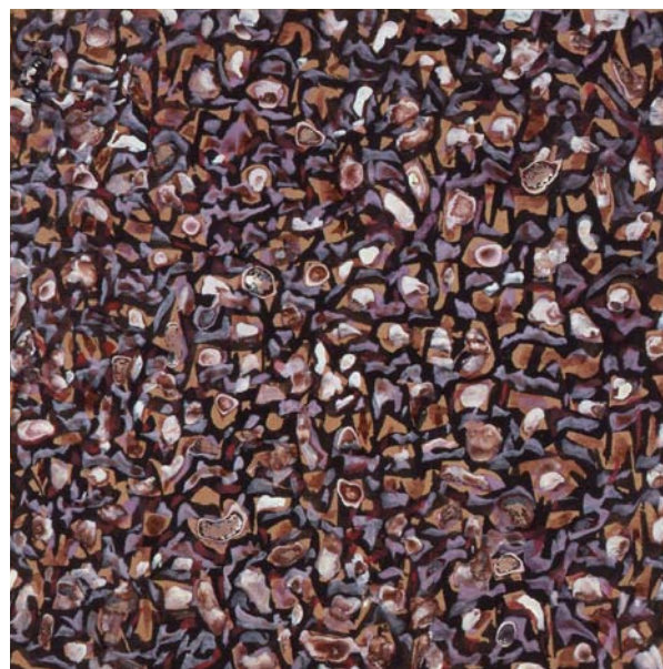
Le Monde Des Cailloux , 1959 - Tempera sur papier - 15 x 14,7 cm