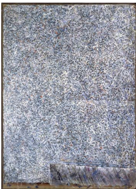
Escape From Static , 1968 - Tempera sur papier marouflé sur panneau - 67 x 48 cm © Veignant