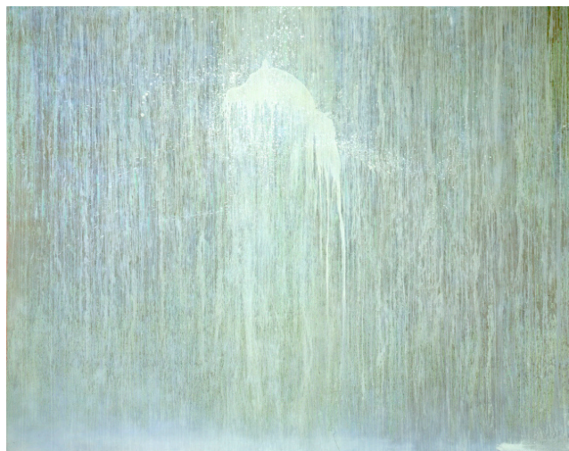
Ghost Moon , 2004 Huile sur toile - 278,1 x 348 cm