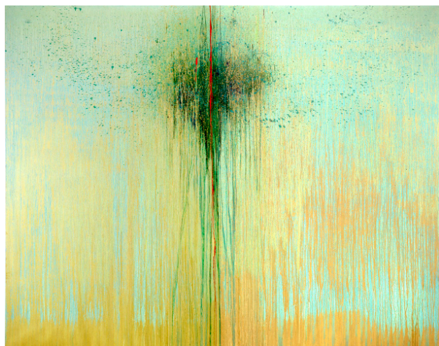
Summer Moon , 2005 Huile sur toile - 278,1 x 348 cm