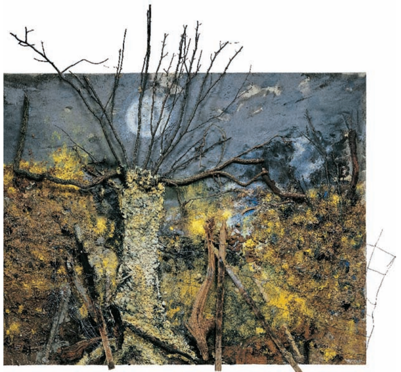
La barrière , 2000 Technique mixte sur toile - 250 x 270 cm