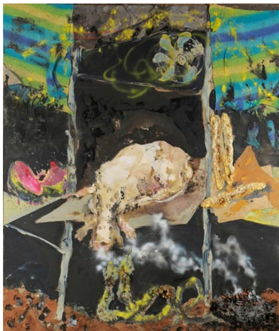
Le Chien blanc , 2000 Technique mixte sur toile 278 x 240 cm

Centrée autour du monumental "Chien blanc" somptueux dans la richesse de son récital de formes, d'images, de tonalités, qui s'écoute autant avec les yeux, le cœur que l'esprit dans sa densité magique, l'exposition propose le dialogue majeur avec le complexe paysage de "La barrière", grandiose et puissante célébration de la nature dans son état brut. Il se poursuit avec des compositions autour de corps, humains ou animaux, d'une sensualité souveraine soulignée par des matériaux barbares – sans trouver d'apaisement dans le taquinage de "La grande truite". Et la sculpture "Le sanglier" trône au centre de ces débats vigoureux, concentrée dans son destin de fauve mal adapté à un destin de vedette.