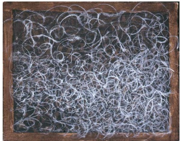
Sans titre, 1960 - 1962 Tempera sur papier 13,2 x 16,5 cm

Pionnier de l'Abstraction américaine et mondialement reconnu , Mark Tobey refuse les catégorisations, son œuvre cherche les clés ou les signes d'une peinture qui représente et signifie en même temps ; elle exprime son souci de révéler la structure profonde des choses. Grand explorateur, l'artiste aime se trouver Entre les Mondes (Between Worlds) . Il réalise que le monde de l'art conventionnel et clos des pseudo-traditions est un obstacle à l'épanouissement de l'homme.