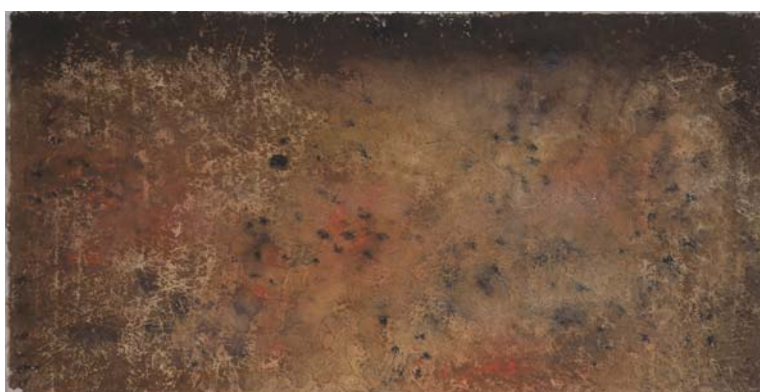
Sans titre , 1961 - Monotype - 48,5 x 99 cm